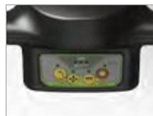
ZAPROGRAMOWANE TRYBY PRACY