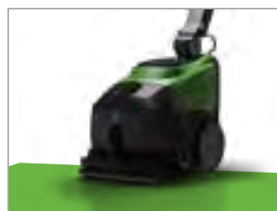
ZESTAW DO EKSTRAKCI - OPCJA